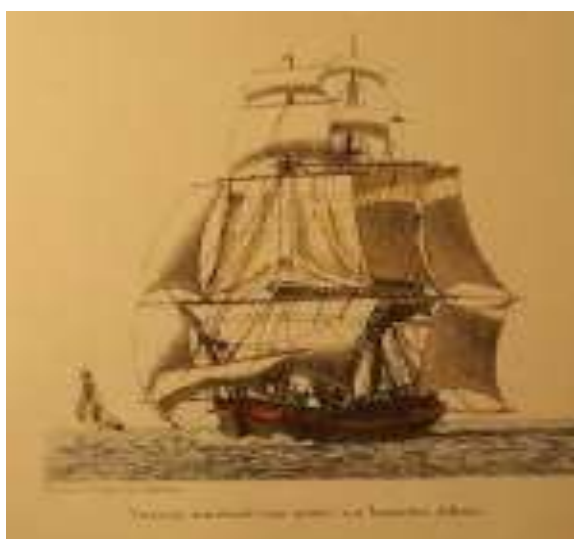
Représentation d'un vaisseau marchand du 19 ième siècle.