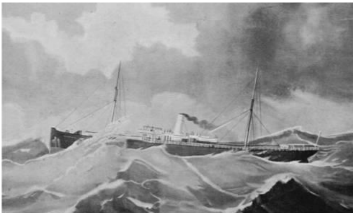
Image du Pembridge , construit à la même époque que l' Edenbridge pour la même compagnie mais pas par le même constructeur.