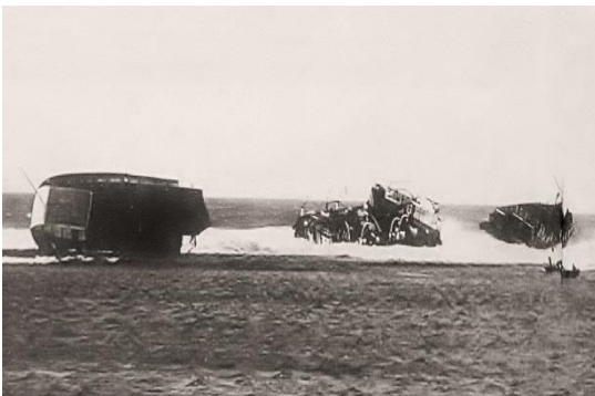
Le Bruxelles, sur le récif de Saint Pierre