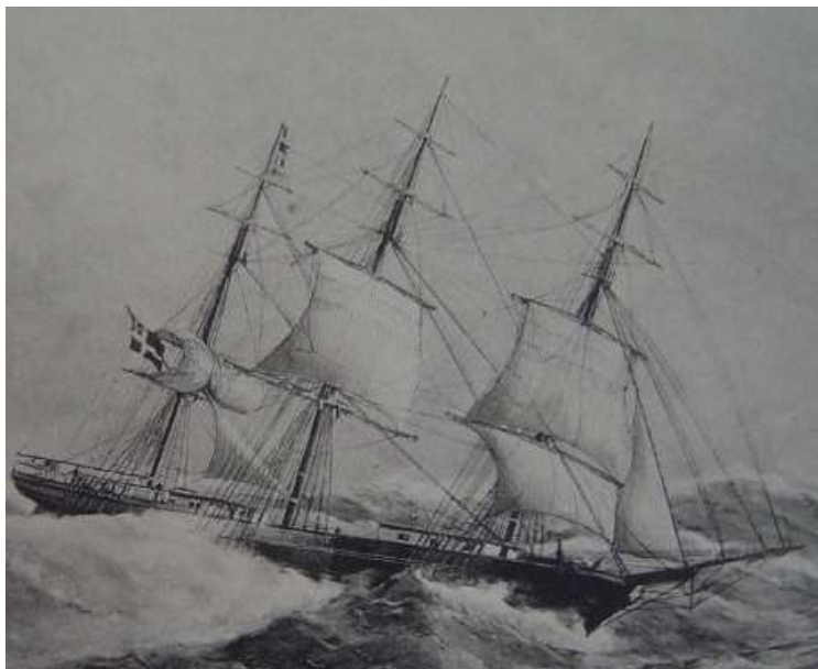
3 mâts de commerce pris dans la tempête.