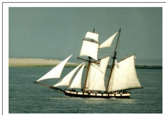
La Recouvrance, goélette classe Iris. Reconstituée.