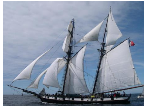
La Recouvrance, Goélette des années 1830, armée en guerre.