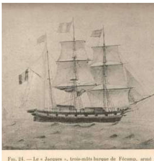
FIG. 21. — Le « Jacques », trois-mâts barque de Fécamp, armé