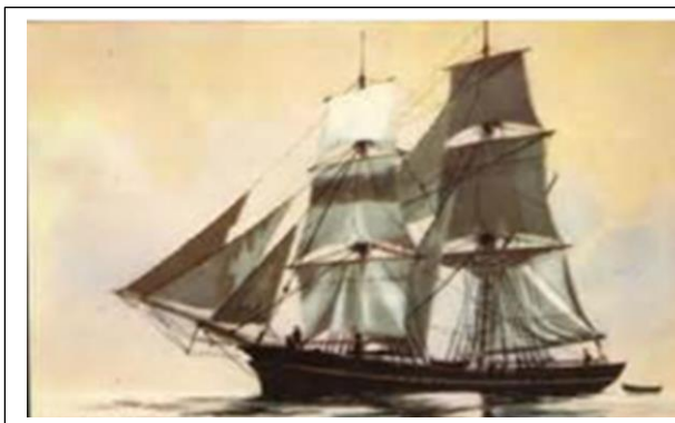
Image d'un brick anglais 1845, navire rapide à voiles carrées.