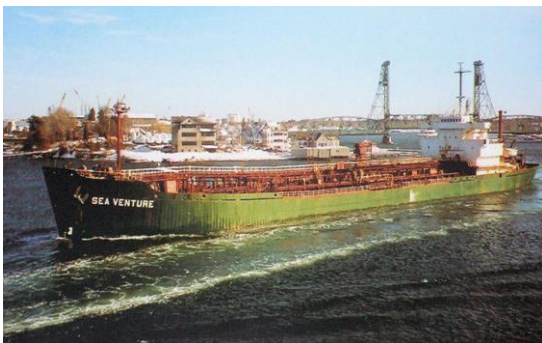
Sea Venture fin des années 1970. Nous ne sommes pas certain qu'il s'agisse du même Navire.