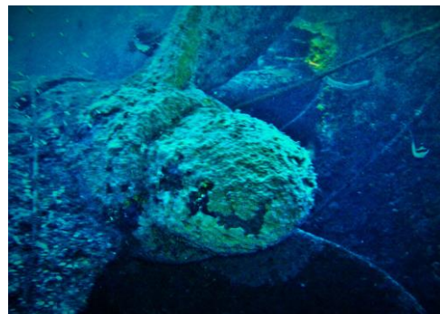
Une des 2 hélices (42m)