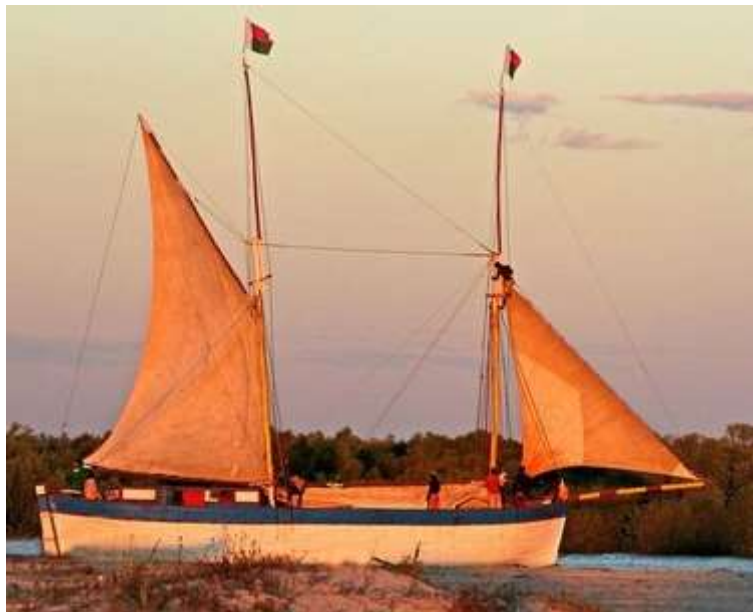
Goélette construite dans les Mascareignes.