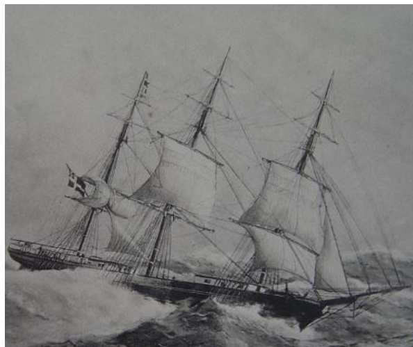
Représentation d'un 3 mâts en pleine tempête.