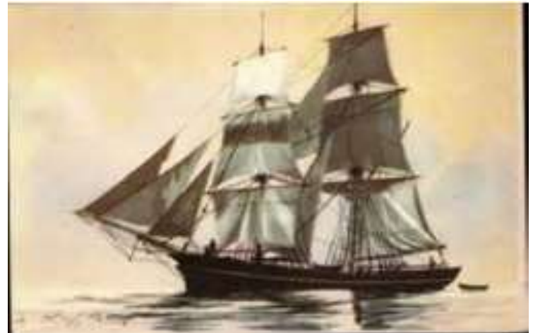
Brick ou Brig.