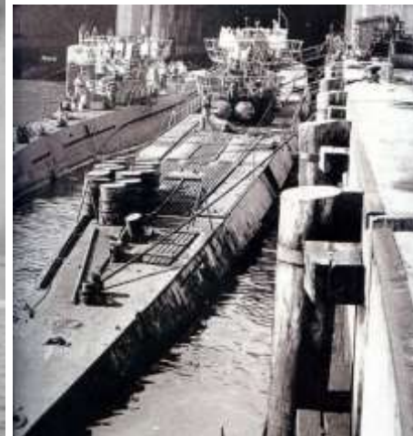
U-861 Type IX D2, idem U-181