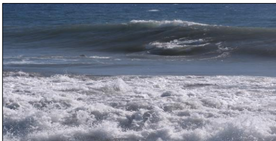
Lieu du naufrage