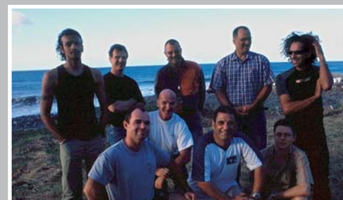
Une partie des membres de la Confrérie des Gens de la Mer