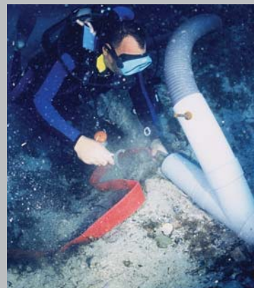
Utilisation d'une moto-pompe dans le cadre d'une fouille archéologique sur une épave.