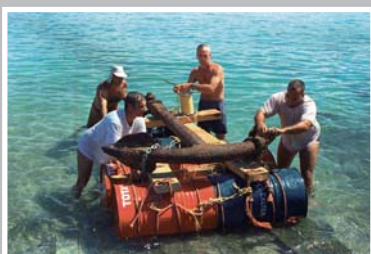
Mise en place d'une ancre pour le jardin archéologique dans le lagon de St Gilles.

Pour toutes ces raisons, le travail archéologique entrepris par la Confrérie des Gens de la Mer demeure lent et difficile.