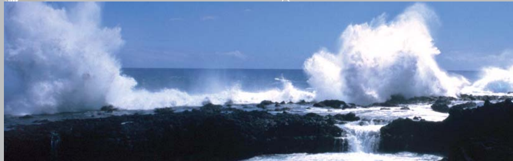
Forte houle sur la côte Ouest de La Réunion.