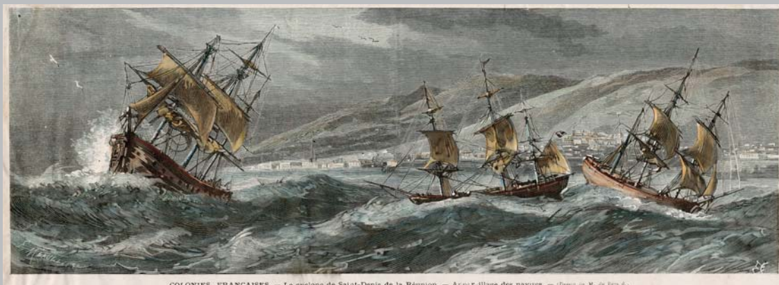
COLONIES FRANÇAISES. — Le cyclone de Saint-Denis de la Réunion. — Appariillage des navires. — (Dessiné de M. de Bois de).