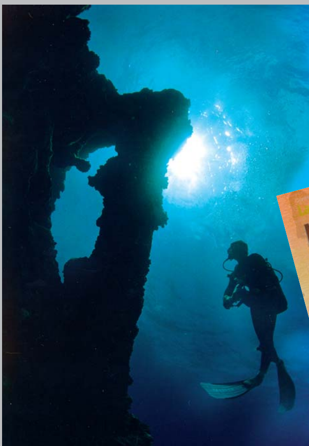
Prospection sous-marine près de St Gilles. Collection Confrérie des Gens de la Mer