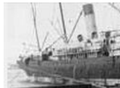
Le SS New Zealand