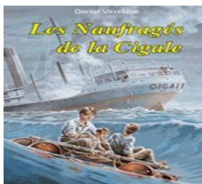
Illustration du livre de D. Vaxelaire