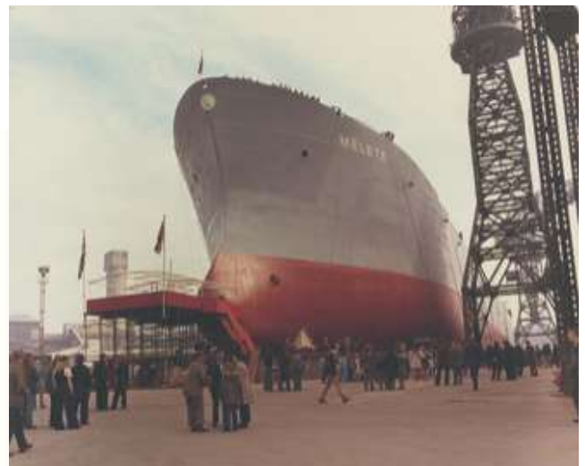
Lancement du Melete le 24 avril 1975. 228m/32m/14m.