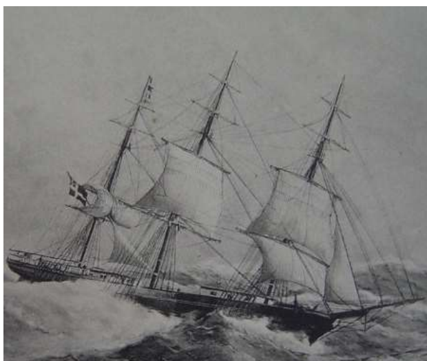
Image d'un trois-mâts de commerce dans le gros temps.