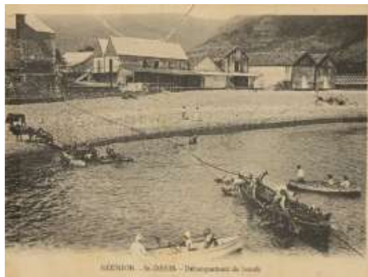
Chaloupe et pirogue en plein travail.