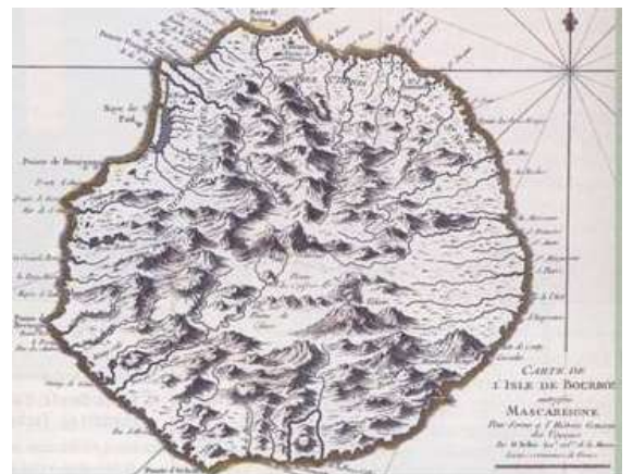
Carte de l'île Bourbon début 18 ème siècle ;