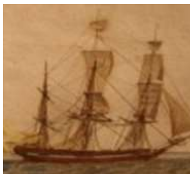
Peinture 3 mâts marchand Américain 19è