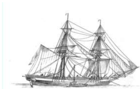
Reproduction d'un Brick ou Brigantin de commerce en 1818.

Cargaison : Café, encens, gomme arabique