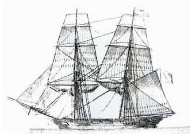
Représentation d'un Brick marchand du 19 ième siècle.

Cargaison : Café et sucre de l'île de France