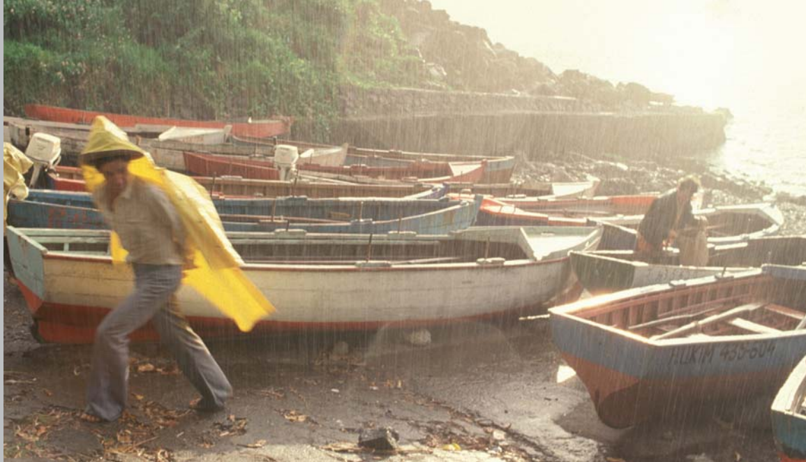
Ancien port de Ste Rose, 1985.

Les canots que l'on peut encore voir aujourd'hui hissés sur le bord de mer, sont les héritiers d'une longue tradition réunionnaise de construction navale, transmise au fil des générations.