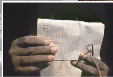
Précieuses notes de montage sur le petit carnet de l'artisan. Collection privée