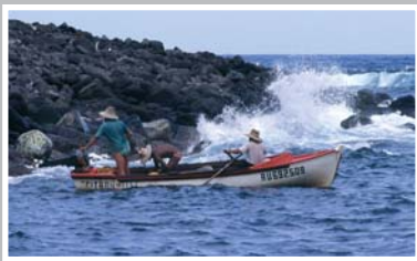
Sortie en mer à l'Anse des Cascades.