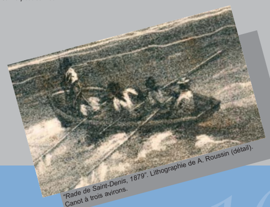
*Rade de Saint-Denis, 1879*. Lithographie de A. Roussin (détail). Canot à trois avirons.

Patron : dans la marine, celui qui commande une petite embarcation.