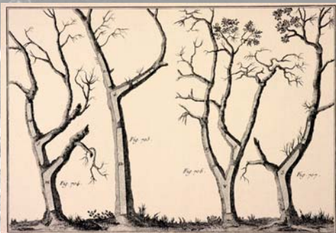
«Martelage de bois» Encyclopédie de la Mer. Collection privée