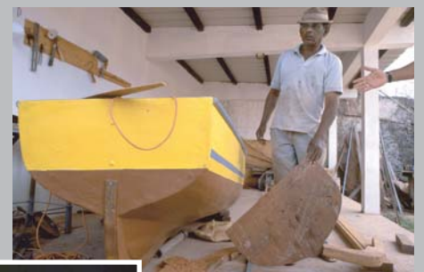
Monsieur Gopal, charpentier de marine, maintenant à la retraite.