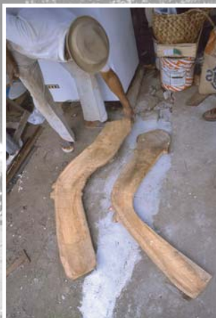
Vérification des bois de construction.