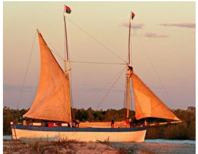
Goélette construite dans les Mascareignes.