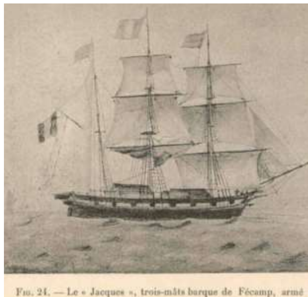
FIG. 24. — Le « Jacques », trois-mâts barque de Fécamp, armé