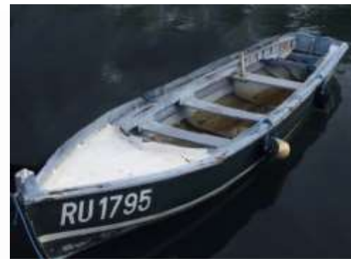
Canot de pêche.