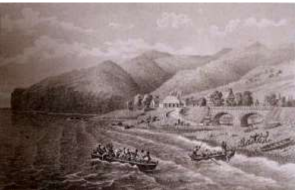
Chaloupe de transport passager.