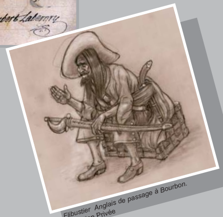
Filibustier Anglais de passage à Bourbon.

Pirate : aventurier qui court les mers pour se livrer au brigandage. Forban : terme sous lequel on désignait autrefois les pirates. Tripot : maison de jeu.