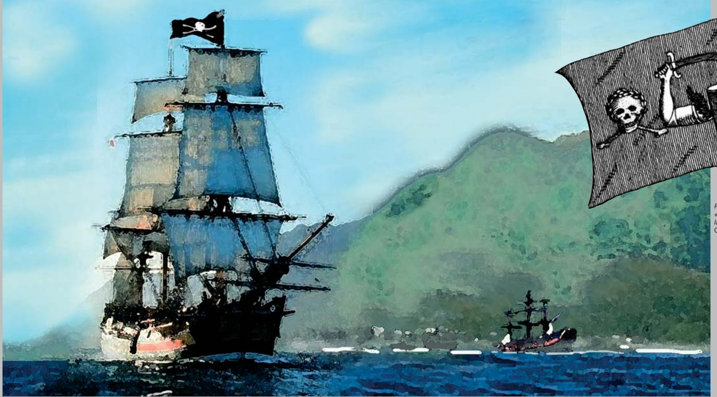
Navire forban en maraude au large de Bourbon. Collection privée