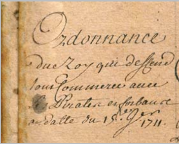
Ordonnance du Roi qui défend tout commerce avec les pirates et forbans, en date du 15 Septembre 1711. Fonds Archives Départementales de La Réunion Co1 (détail)

Les pirates fréquentent les côtes de Bourbon de la fin du XVII e siècle jusque vers les années 1720. Leurs richesses attirent la convoitise des habitants de Bourbon qui les accueillent toujours avec empressement, car ils payent tout ce qu'ils achètent comptant et sans discuter les prix.