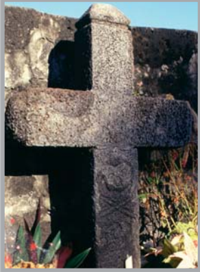
Croix gravée du cimetière de St Paul, qui pourrait avoir été celle d'un pirate. Collection privée