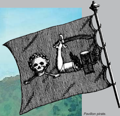
Pavillon pirate. «Encyclopédie de la Marine». 1787