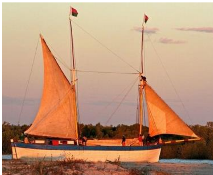
Deux types de navires appelés Goélette.