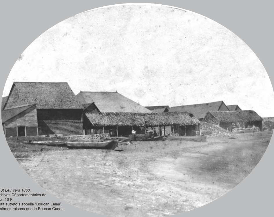
Plage de St Leu vers 1860. Ce lieu était autrefois appelé "Boucan Laleu", pour les mêmes raisons que le Boucan Canot.