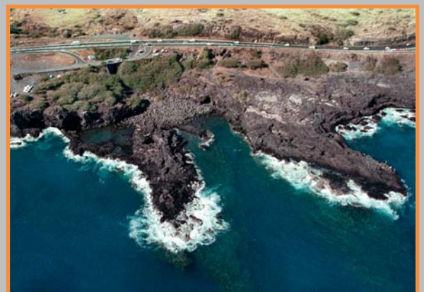
Vue aérienne du Cap Lahoussaye près de St Paul.