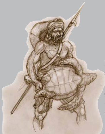
Chasseur se rendant au boucan.

Aujourd'hui encore, sur le pourtour de l'île, de nombreux endroits portent un nom lié à l'histoire maritime de La Réunion. Qu'il s'agisse par exemple de tous les lieux-dits La Marine situés dans les différentes communes, qui perpétuent le souvenir des nombreux points de la côte où s'embarquaient et se débarquaient passagers et marchandises.