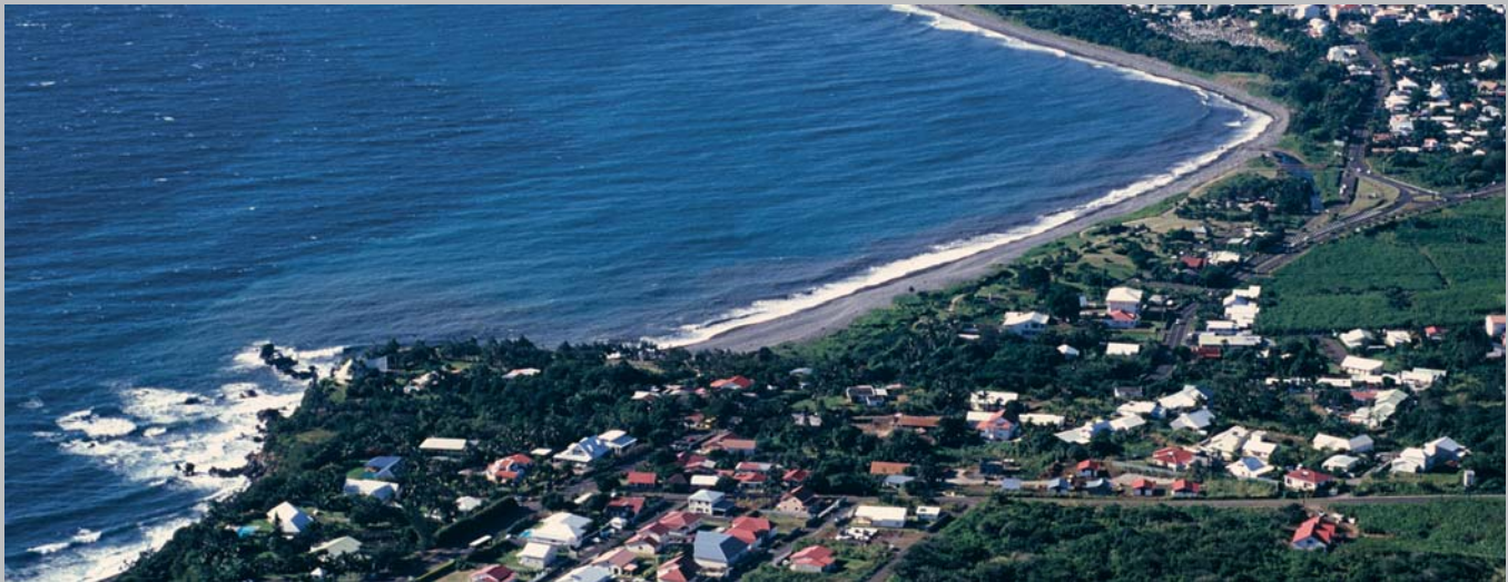
Marine du Bourbier à St Benoît.