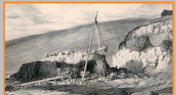
"Patent-slip" à St Gilles". Lithographie de A. Roussin. Ce patent-slip qui se trouvait en Baie de St-Paul a donné son nom à la ravine qui se jette dans l'océan au Cap La Houssaye.

Sémaphore : moyen de signalisation établi sur une côte pour signaler les navires et correspondre avec eux. Sans-culotte : autre nom sous lequel on désigne les révolutionnaires. Boucan : mot d'origine amérindienne désignant la manière de cuire les viandes afin de les conserver Patent-slip : cale de halage servant à l'entretien des embarcations de petit et moyen tonnage.